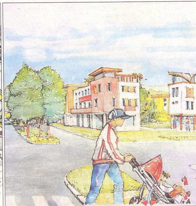
Kresba Ludmila Mířková Pohled na budoucí klimentovskou obchodní třídu. Kresba Ludmila Mířková