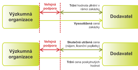
Schéma: Kvantitativní vyjádření veřejné podpory při zadávání veřejných zakázek a při nakládání s hodnotami pořízenými vytvořenými v rámci projektu financovaného z veřejných zdrojů

The currently held negotiations of a number of successful projects is also the last opportunity to ponder on the legislation of mutual relationships in the so-called partner contracts, eventually in other co-operation agreements on supported projects. It necessary to pay attention especially to the questions of actual functioning of the co-operation in the "sustainability period", protection of subsidy receivers' interests in relation to other co-receivers (partners), common use of the property (the property acquired in the project and brought in/being brought in) and last but not least protection of intellectual property (right origination, access to objects, schedules of their use by participating subjects etc.).