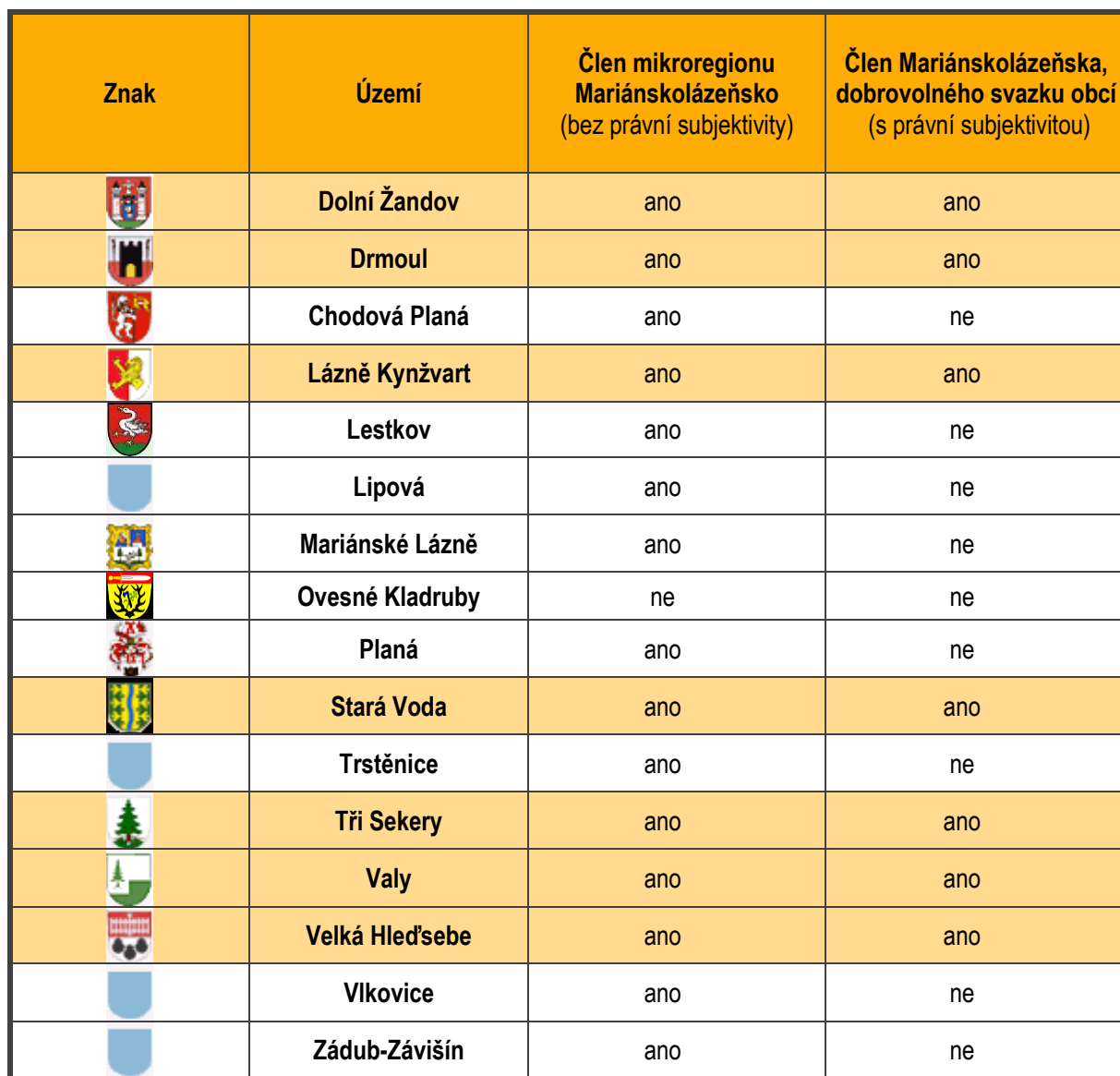
Tab. 1: Města a obce Mariánskolázeňska